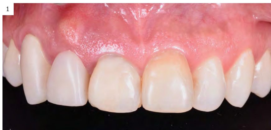
Figura 1. Estado inicial del caso clínico presentado.

Se presenta un caso de un paciente que sufrió un accidente provocando traumatismo dentoalveolar severo e irreversible en el incisivo central superior derecho y en el lateral superior derecho. Además, el incisivo central superior izquierdo y el canino derecho presentaban un tratamiento endodóntico previo y una reconstrucción directa y una corona desadaptada respectivamente, cambio de coloración y requerían el recambio de la prótesis (Fig. 1). Debido a las condiciones previas de los dientes adyacentes se consideró pertinente la solución del caso mediante prótesis dentoportada. Se planificó entonces realizar una prótesis parcial fija de zirconio cerámica de 4 elementos. Se realizaron las exodoncias mínimamente traumáticas de los dientes fracturados (12 y 11), realizando además preservación alveolar y se prepararon los dientes pilares sin línea de terminación, bajo los principios de la preparación vertical, realizando además un "gingitage" a nivel del tejido epitelial y conectivo de la pared del surco gingival, mientras que por el lado denta-